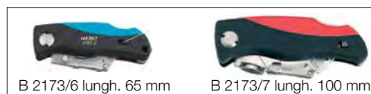
B 2173/6 lungh. 65 mm